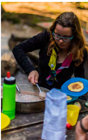
Beim "Dessertcontest" ist Kreativität gefragt.