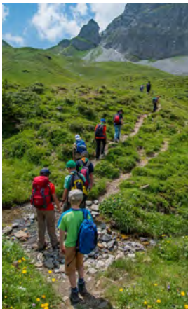
Auf der Tageswanderung suchten die Pfadis nach dem einen Ring. Einige der Pfadis zog es dabei hoch hinaus: Auf der Grimmelalp wurde die Gruppe fündig.