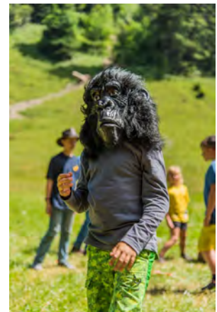
Im "Dschungelbuch" forderten einige Affen die Pfadis heraus.