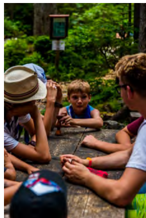
Jeden Abend wurde das Erlebte in der Gruppe besprochen.