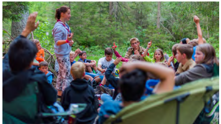
Die Pfadis stimmen beim "Werwölfe" über ihre nächsten Schritte ab.