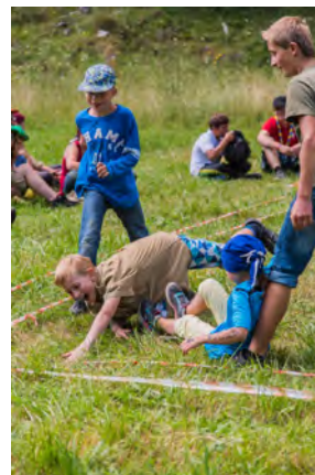
Beim "Bulldoggen" zeigten viele vollen Einsatz.