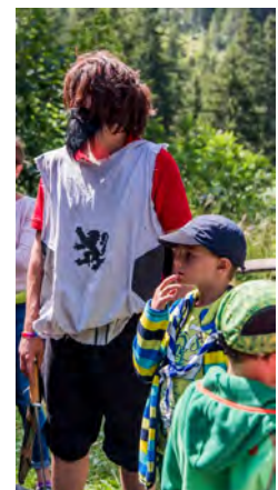
Gimli sucht bereits länger nach dem Ring.