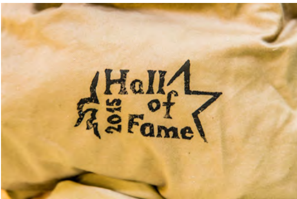
Im Lager konnte man seine Uniform mit einem passenden Lagerdruck schmücken lassen